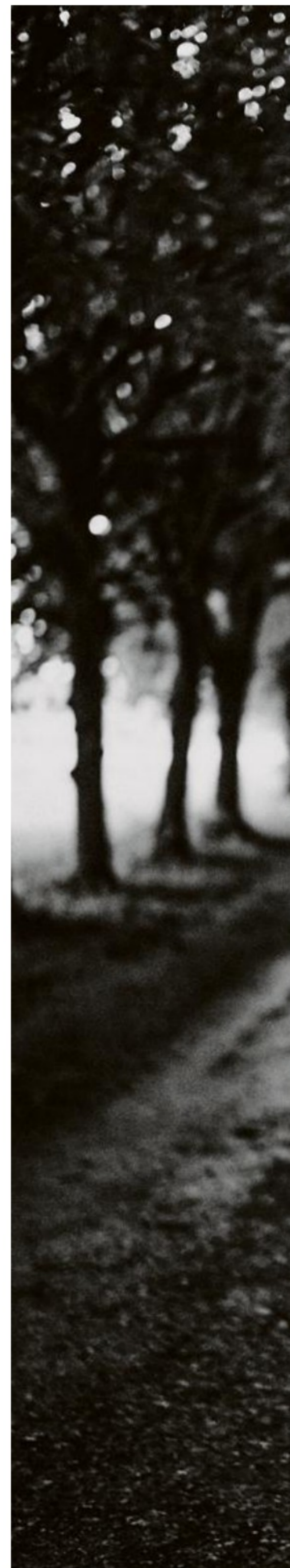
Manfred Kahn à Fontainebleau.

«Ce qui me sauve de la grandiloquence, c'est mon goût théâtral pour les séries B.»